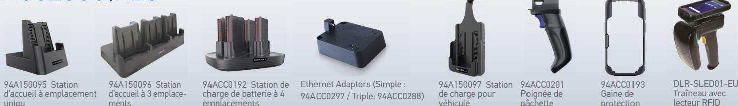
94A150095 Station d'accueil à emplacement unique