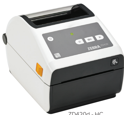
ZD420d - HC

Dans le secteur critique de la santé, fiabilité et précision sont de rigueur. Les imprimantes ZD420-HC de Zebra présentent des caractéristiques et des fonctionnalités qui facilitent comme jamais le déploiement, la gestion et l'utilisation, offrent une grande flexibilité des applications et réduisent le coût total de possession. Conçue pour l'industrie de la santé, cette imprimante résiste aux désinfections répétitives et est équipée d'un bloc d'alimentation conforme aux normes médicales. Déclinées en modèles thermique direct et transfert thermique, les imprimantes ZD420-HC combinent le système d'ouverture « bivalente » Zebra à une interface intuitive. Grâce à sa résolution de 300 dpi (en option), les étiquettes restent nettes et lisibles, aussi petites soient-elles. Les imprimantes ZD420-HC exploitent Link-OS® et sont prises en charge par Print DNA, puissante suite d'applications, d'utilitaires et d'outils de développement qui améliore l'expérience d'impression, grâce à une meilleure performance, une gestion à distance simplifiée et une intégration plus aisée. La ZD420-HC : l'imprimante qui conjugue simplicité d'utilisation, souplesse et facilité de gestion.