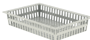
N° d'art. 10164101 Panier 600 x 400 x 100 mm (l x L x H), convient à des séparations