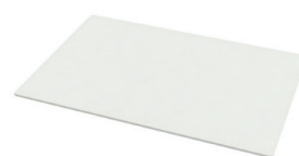
N° d'art. 1346401 Étagère pleine, 600 x 400 mm

Le volet roulant peut être facilement retiré du chariot en aluminium sans le moindre outil afin d'être nettoyé.